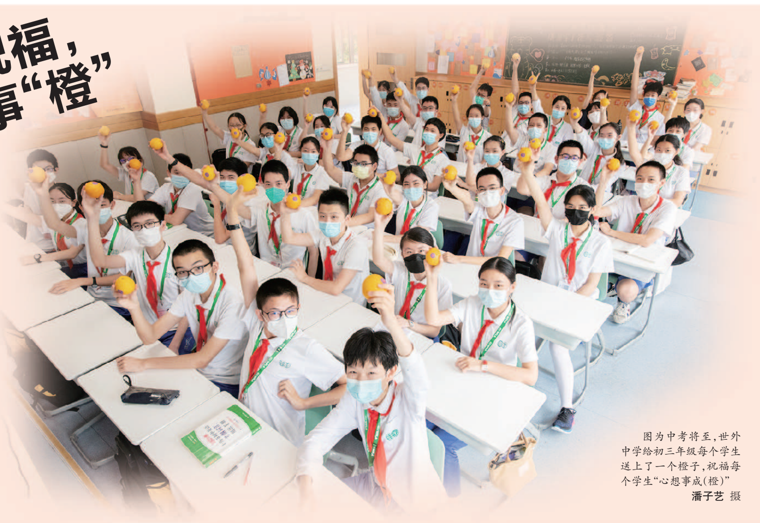
图为中考将至,世外中学给初三年级每个学生送上了一颗橙子,祝福每个学生“心想事成(橙)”