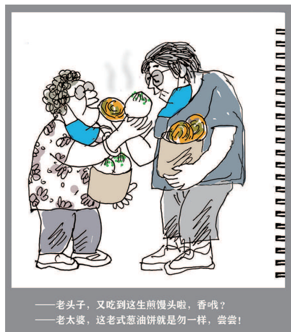
▶《宅家漫画日记选》 天呈