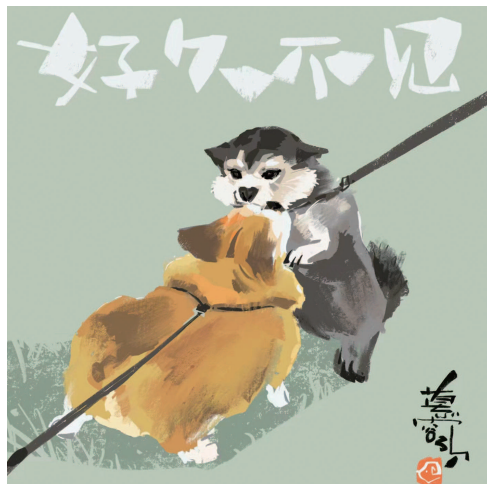
■《好久不见》 慕容引刀