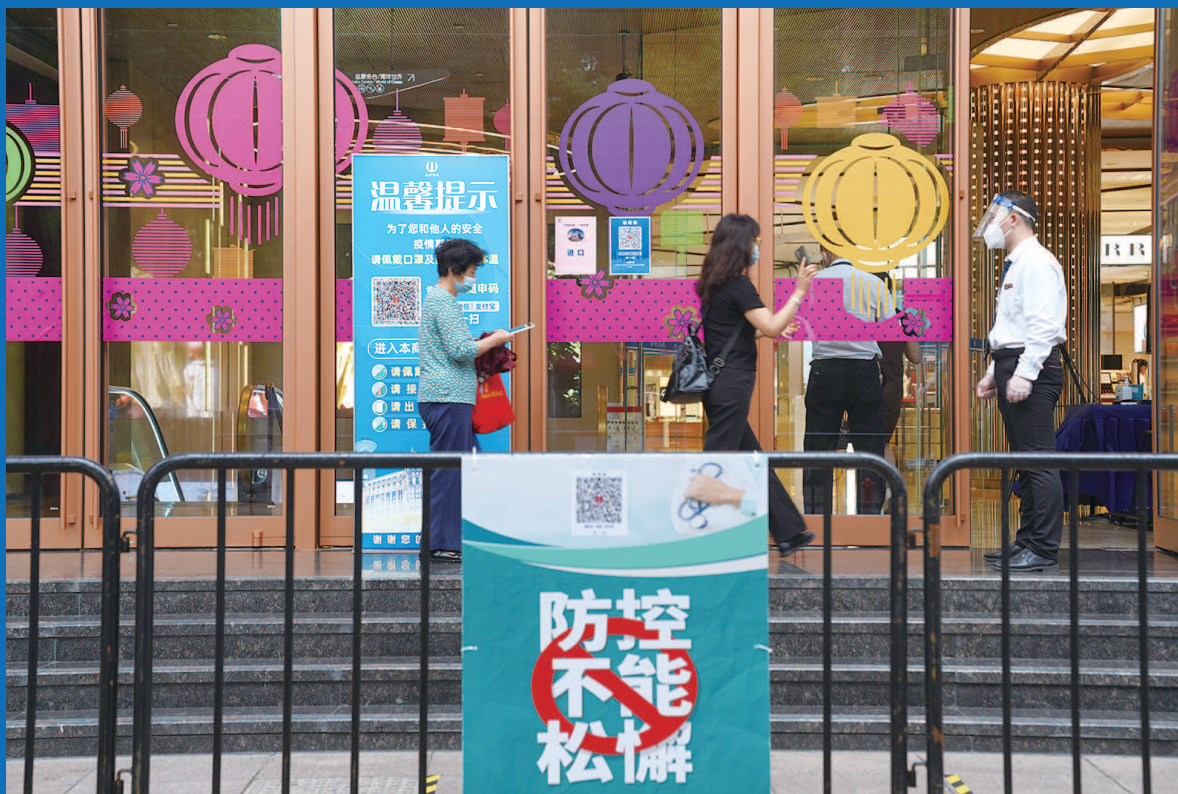
■今天上午,准备进店的市民在新世界城门口扫描“场所码”,并接受体温检测