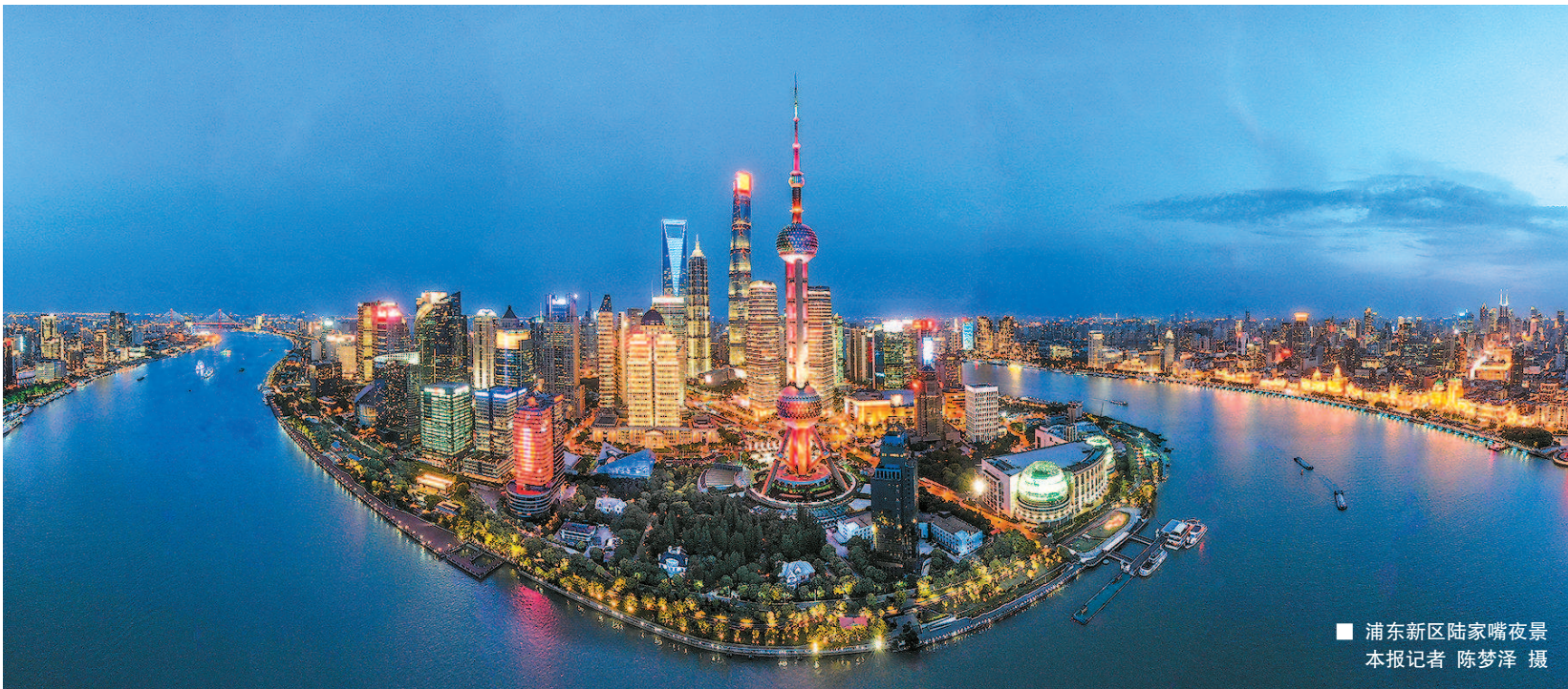
■ 浦东新区陆家嘴夜景

上海,因改革开放而生,因改革开放而兴。2017年,我国自主研制的首款大飞机C919从浦东机场起飞,完成首飞。这一年,上海的改革创新同样有重大进展。中国首个自贸试验区——上海自贸试验区建设总体实现三年预期目标,累计100多项制度创新成果在全国复制推广,区内新增企业4万家,超过挂牌前20多年的总和。