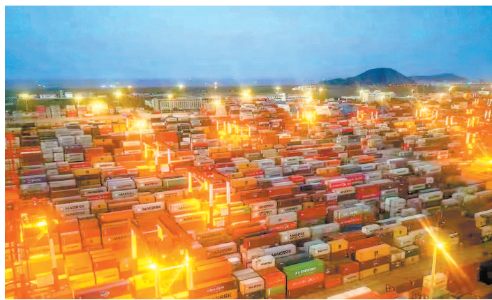
▲ 2022年5至6月,洋山深水港复工复产有序推进。上海持续优化营商环境,全力稳定企业在沪发展的预期和信心