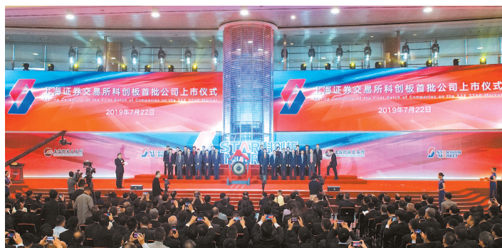
▲ 2019年6月13日,上海证券交易所科创板开板仪式举行。7月22日,首批25只科创板股票上市交易,科创板开市