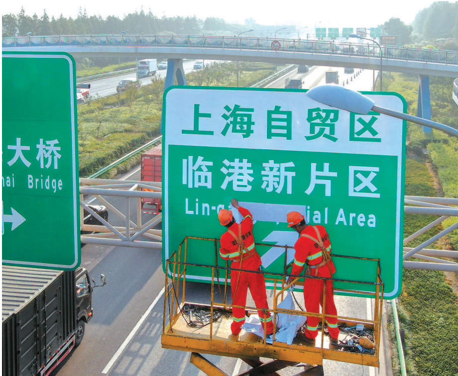
▲ 2019年8月6日,国务院印发《中国(上海)自由贸易试验区临港新片区总体方案》,设立中国(上海)自由贸易试验区临港新片区

潮涌东方。5年来,上海始终坚持对标最高标准、最好水平,着力推动更深层次改革、更高水平开放、更大力度创新,加快形成了一批具有集中度和显示度的重大成果,一步步将改革开放向纵深推进。 本报记者 宋宁华