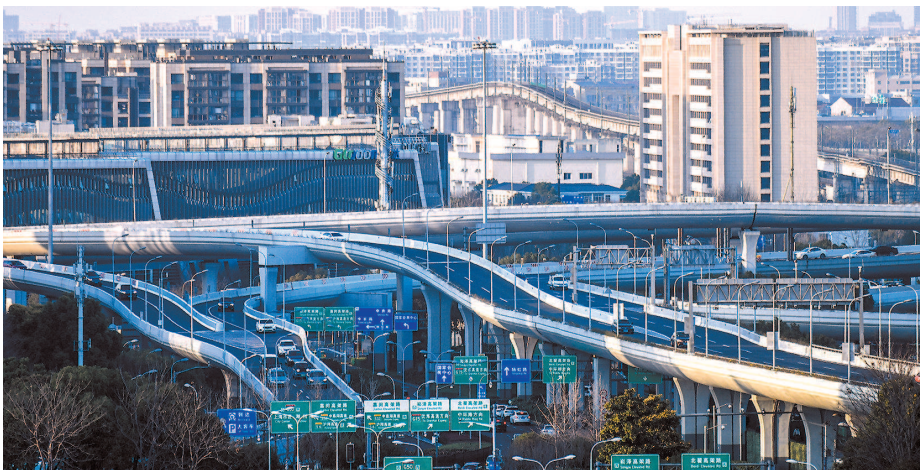
▲ 2021年2月18日,国务院批复《虹桥国际开放枢纽建设总体方案》。图为上海虹桥商务区,主要承担国际化中央商务区、国际贸易中心新平台和综合交通枢纽等功能