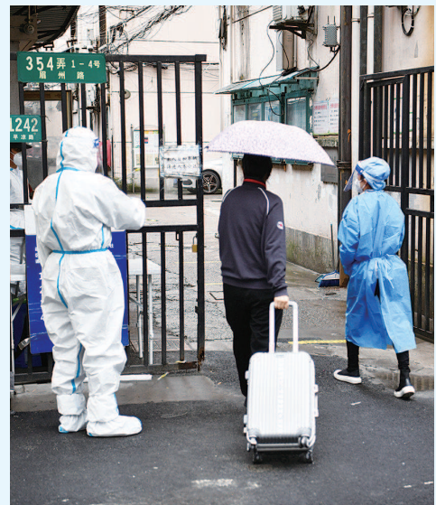
▲张女士在居委会工作人员陪伴下进入小区