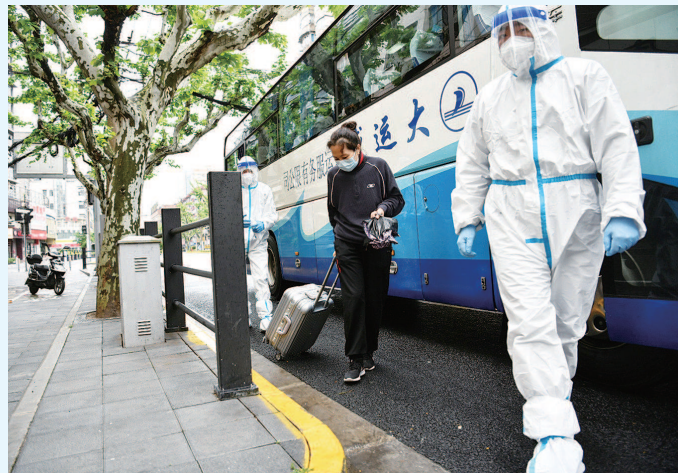
▲张女士走下转运大巴