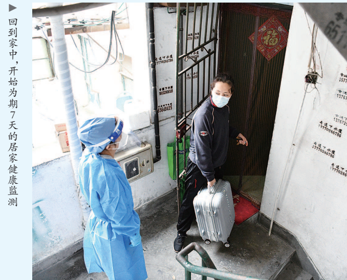
▶回到家中,开始为期7天的居家健康监测