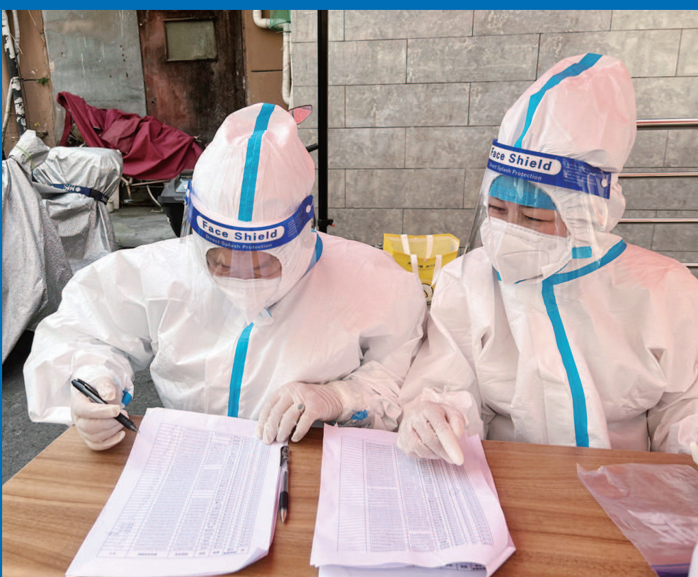
■ 静安区社会组织工作人员正在参与社区网格化筛查