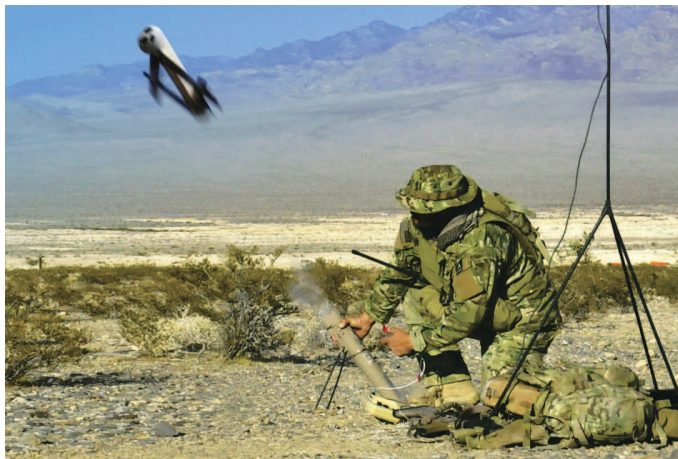
美国向乌克兰提供“弹簧刀”无人机