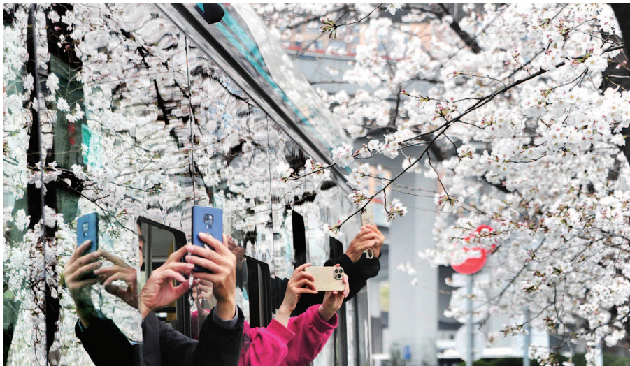
在大片樱花掩映下,南浦大桥下的交通枢纽近日呈现春意盎然的醉人美景

在春分节气,上海时常乍暖还寒、忽晴忽雨。上海春分节气的常年平均气温11.5℃、平均降水量53.4毫米。气象意义的春天常在这个节气里到来。暖空气不断增强,冷空气不肯放弃,两大“势力”交锋,天气容易出现波动。不过春寒总是暂时的,挡不住越来越暖的趋势。