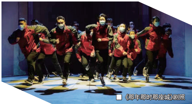
《那年那时那座城》剧照

我们会看到，人间所有的罪恶，我们所有的痛苦，都会淹没在充满全世界的慈爱之中……”隔着屏幕，话剧《万尼亚舅舅》的经典台词依然能深深打动观众的心。音乐剧《那年那时那座城》取材自上海援鄂医疗队从出征到凯旋的真实经历，这部剧通过音乐剧的形式，在特殊的时期里，向社会传递更多的正能量。