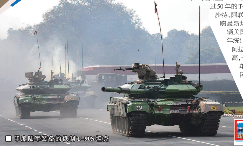
印度陆军装备的俄制T-90S坦克

中东各国保有9497辆坦克,那里以平坦沙漠为主,非常适合坦克作战。但中东阿拉伯国家坦克质量参差不齐,多数国家仍使用车龄超过50年的T-54/55、T-62等老式坦克,沙特、阿联酋等石油富国能从美欧采购最新坦克,像沙特陆军装备450辆美国M1A2主战坦克,比2015年统计的200辆翻了一番多。但阿拉伯装甲兵战术素养普遍不高,士兵战斗意志不强,像2019年也门基塔夫战役中,胡塞民兵歼灭沙特出人出枪武装的也门哈迪政府军一个装甲旅,击溃两个,毙敌500人,俘虏2400人,缴获坦克近百辆。