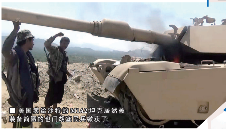
美国卖给沙特的M1A2坦克居然被装备简陋的也门胡塞民兵缴获了

强大的美国陆军正持续缩减坦克,从2015年的3500辆砍到如今的2509辆,尽管最先进的M1A2SEP1坦克增加了200辆,但已不复“当年之盛”。美军即便提出战备要回归“大国竞争”轨道,但装甲兵仍以轻量化轮式装甲车为主,导致坦克研制放缓,坦克数量下降。北美第二大加拿大,正将坦克型号统一为豹2,最后50辆豹1转入预备役,以减轻后勤压力,降低运营成本。再看南美洲和加勒比海各