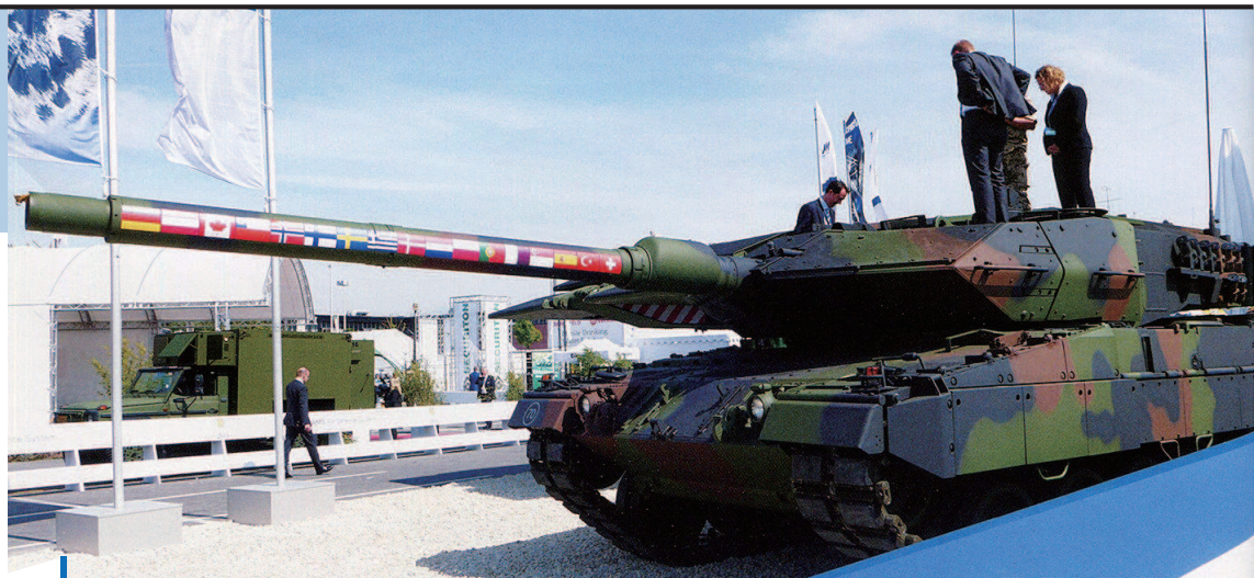
一辆炮管上印满周户国国旗的德国豹2坦克

作为世界知名军刊,日本《战车》杂志每隔数年都要推出世界坦克分布专题,业已形成风格。其最近一期的“今日坦克地图”,距上一次(2015年)已过去6年多,这中间因形势大变、技术进化,导致过于老旧的坦克都不列入统计,也使得“按图索骥”有了新意涵。