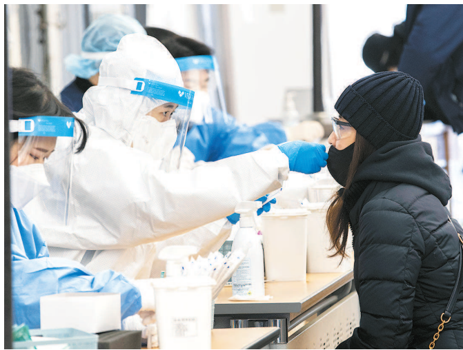
韩国民众接受新冠病毒检测