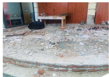
碎石遍地环境脏乱

记者来到现场后看到，这家商铺紧挨着宝钢又一村的正门。商铺本身的大门已不复存在，地面上随处可见大小不一的砖块和碎石。“这样的情况已经持续了将近3年。”陈先生说，该商户几经转手之后