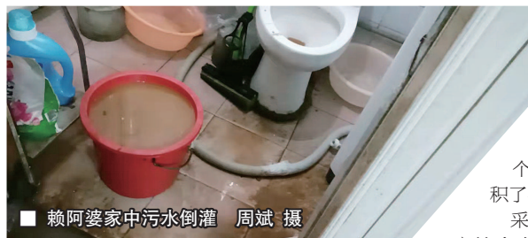
赖阿婆家中污水倒灌

家住宝山区杨行镇克东路50弄小区1号楼的赖阿婆向“帮帮忙”反映，居民楼外排污管堵塞，脏水倒灌入底楼，家中水漫金山、臭气熏天。居民们曾向物业多次反映，问题却一直没能解决。