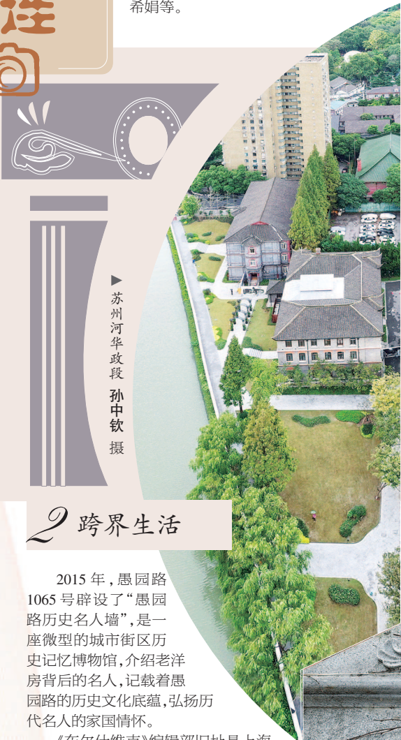
苏州河华政段