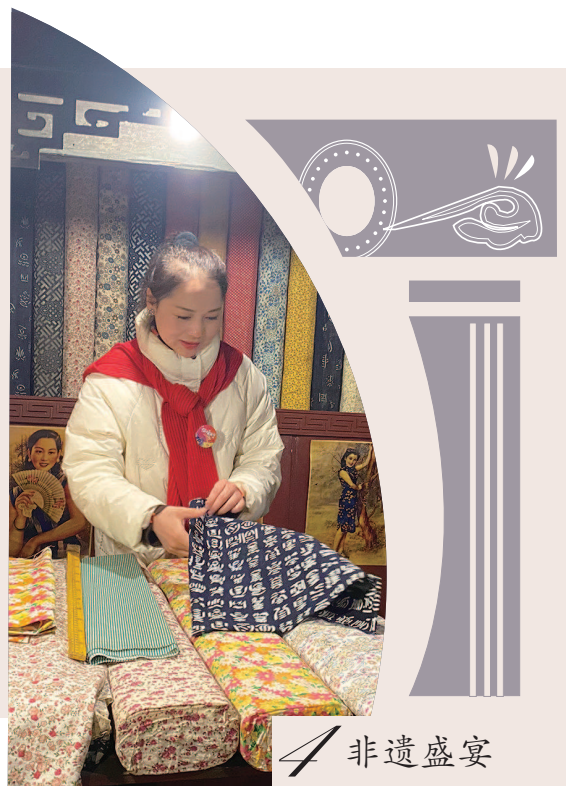
长宁民俗文化中心