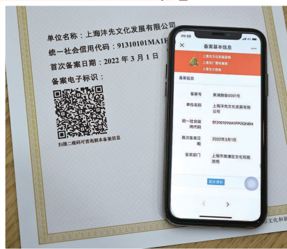
■ 密室剧本杀备案简洁明了