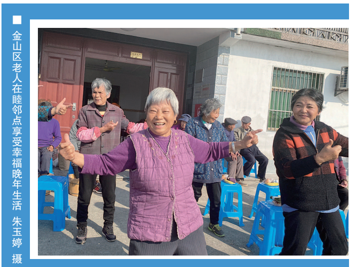
金山区老人在睦邻点享受幸福晚年生活

金山区张堰镇启用“1+1+X”睦邻点活动机制,即每月开展一场由第三方社会组织安排的特色睦邻点活动;每月各睦邻点结合老年人的喜好因地制宜,开展一场睦邻点活动;“X”是指各村居结合工会、共青团、妇联、社区学校等部门力量,开展内容丰富、形式多样的“不定期、不定时”睦邻点活动。这一套“组合拳”,充分让镇内12个市级示范睦邻点、30个普通睦邻点“活”起来、“热”起来,让农村地区老人的晚年生活不再寂寞、孤单。