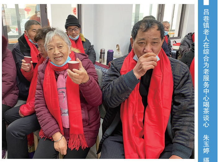
吕巷镇老人在综合为老服务中心喝茶谈心