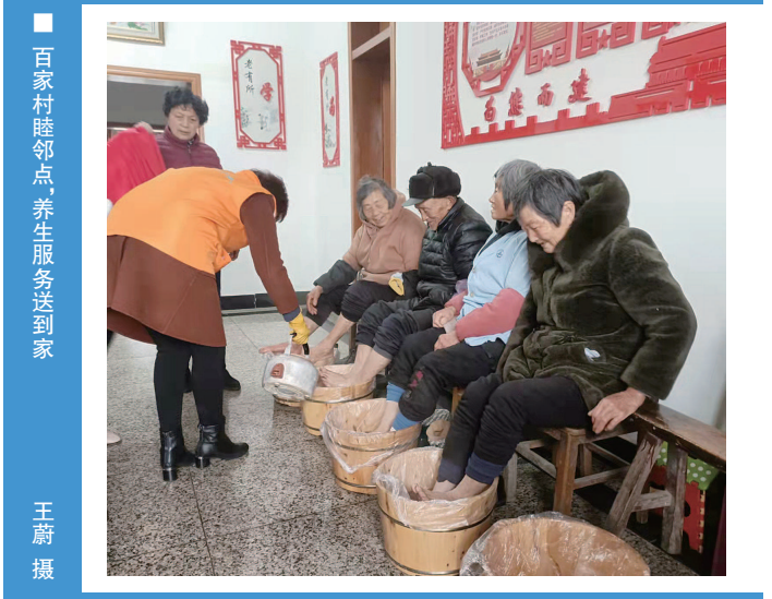
百家村睦邻点,养生服务送到家