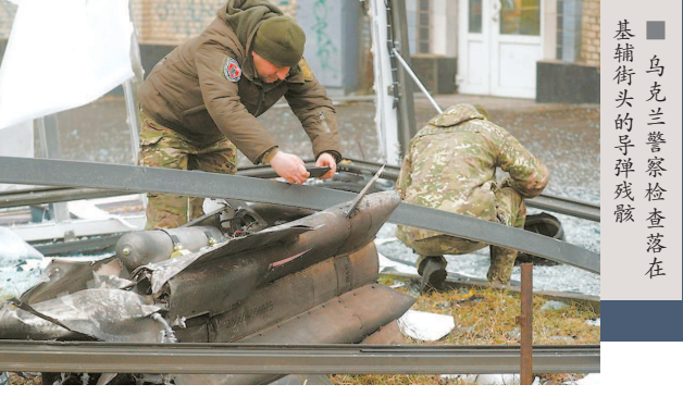
基辅街头的弹壳残骸