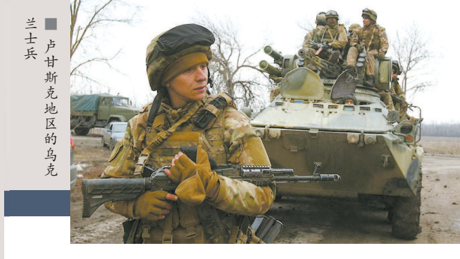
卢甘斯克地区的乌克兰士兵

能够在乌克兰问题上使用“一切选项都在桌上”的外交辞令,俄罗斯是否会行动更加谨慎?如果拜登政府真的无意在乌克兰与俄罗斯对抗,可以选择早点让步,让事态不至于发展到今天的地步。毕竟,对于亲西方的乌克兰现政权而言,吃败仗总比吃败仗要好。如今,肯定有不少乌克兰人对美国先挑畔俄罗斯,再抛弃乌克兰的做法充满了失望和愤怒。 拜登的国家安全团队没有理由预测不到当前的场景。毕竟,美国在乌克兰打的是“明牌”,多次表示无论如何美国都不会在乌克兰与俄罗斯作战。既然“空手套白狼”的危机策略很有可能无法奏效,那么唯一合理的解释就是拜登政府已经做好了在乌克兰危机中“失分”的政治准备。 未来一段时间,俄罗斯必然会抓住当前的战略窗口,实现将乌克兰彻底锁定在自身轨道的关键目标。在达成目标前,俄方还会采取包括动用武力在内的方式,迫使乌克兰对俄做出重大妥协。在这一“失去盟友”的过程中,美国国内对拜登的指责之声也将增强。也许,经历了从阿富汗撤军后的狂飙骤