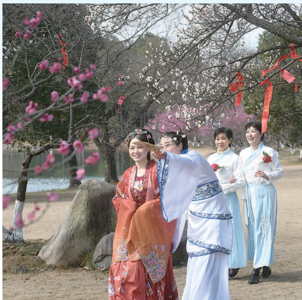
■ 汉服爱好者们身着古装,踏春赏花