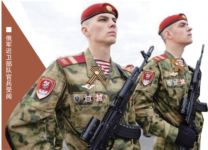
俄军近卫部队官兵受阅