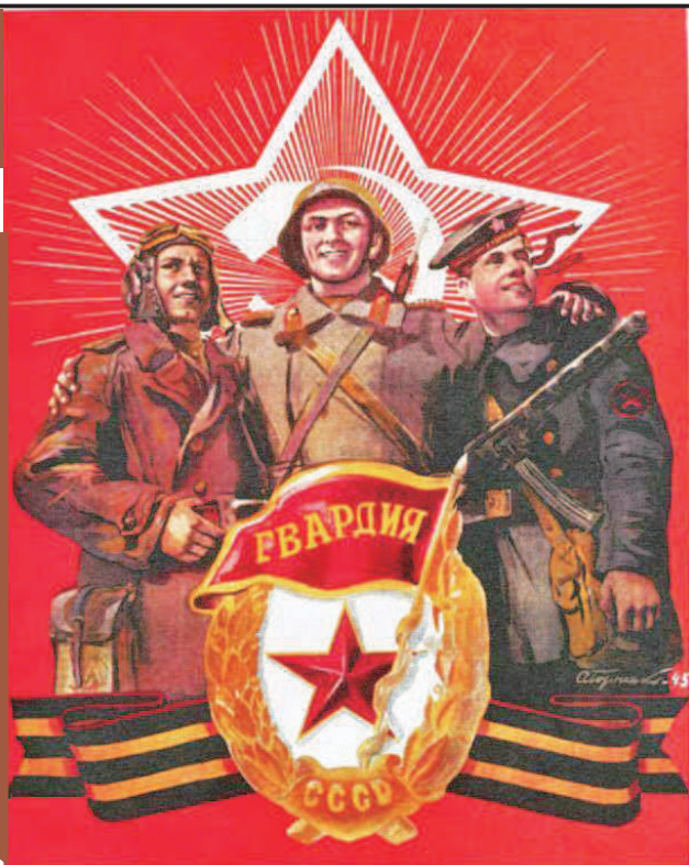
光荣属于苏联近卫军

1941年9月18日，大本营颁布了第308号命令，将步兵第100、127、153、161师改名为近卫第1、2、3、4师，并设立“苏联近卫军”特别徽章，上缀红旗和星星，军衔前缀