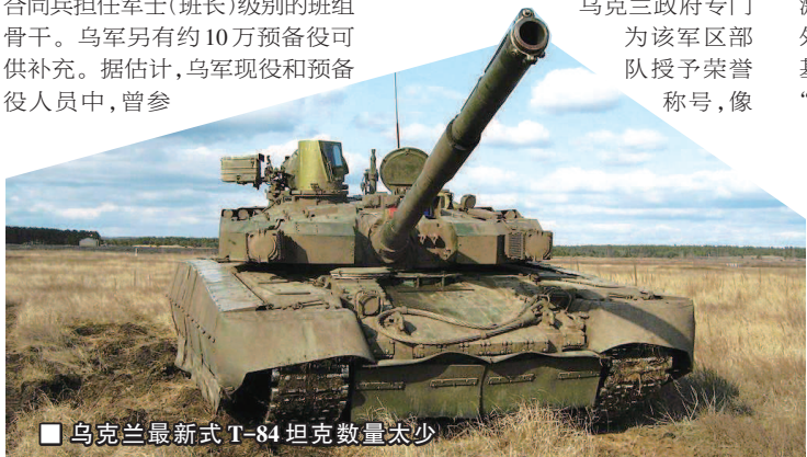
乌克兰最新式T-84坦克数量太少

鉴于乌军装备落后,自2021年起,美国和英国有针对性地军援武器,其中最重要的是轻标枪导弹和NLAW火箭筒,这些武器专供单兵使用,既不显眼,避免俄罗斯过度反应,又能解决乌军最迫切的能力短板——反坦克武器不足。轻标枪导弹射程达2000米,以攻顶模式能击穿任何一种俄制坦克,2018-2021年,乌克兰累计收到37具发射器和200枚导弹,并于2021年11月首次投入乌东实战,摧毁民兵一辆卡车。2022年一开年,美国又紧急送去数百枚轻标枪导弹,乌军兴奋地向网上发布一段视频:携带轻标枪导弹的步兵小组对1500米外的多个俄制坦克靶标实施伏击,结果全都有效摧毁。至于NLAW,是2009年起进入英军的多种用途攻坚武器,射程为20-800米,采用预测瞄准线制导技术,允许士兵躲在房间里发射,射手只要激活火控系统,在ACOG2.5×20瞄准器中稳定跟踪目标3至6秒后即可发射,火箭弹能在预计的目标出现位置爆炸,确保准确命中。目前,英国已援助乌克兰约2000具火箭筒,并派出教官手把手培训。令人意外的是,为加快军援速度,美国甚至把去年没能送给阿富汗政府(被塔利班快速推翻)的毒刺肩扛式导弹、大口径狙击枪、夜视仪转交乌克兰。乌克兰国防部长列兹尼科夫透露,截至2月10日,已接受美国军火共1200吨。 李鹏