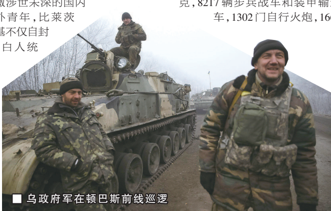
乌政府军在顿巴斯前线巡逻