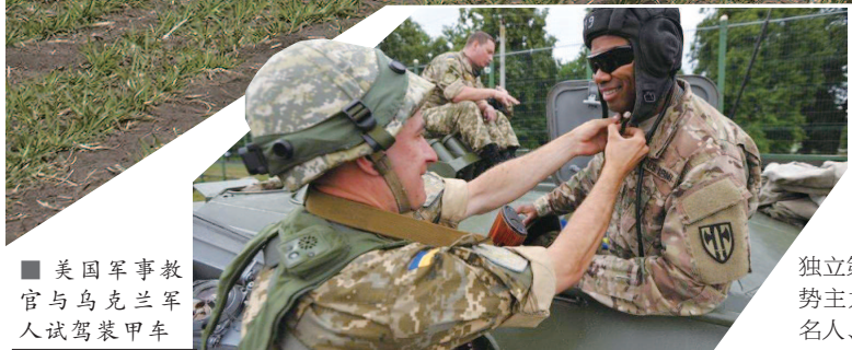
美国军事教官与乌克兰军人试驾装甲车