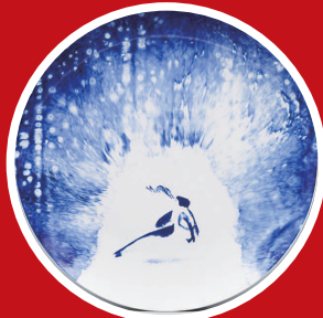
▲《冬·短道速滑》，青花瓷盘