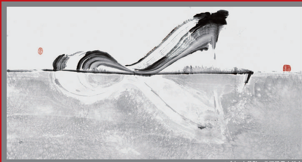
▲《水-水晶鞋 首钢滑雪大跳台中心》，水墨纸本