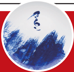
▲《冬·自由式滑雪》，青花瓷盘