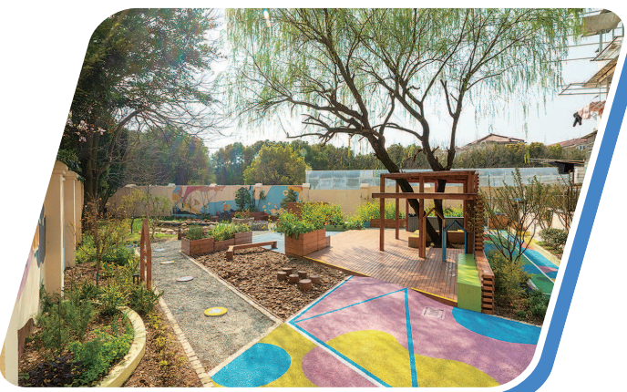
十大“生态环境金点子”评选中的生境花园