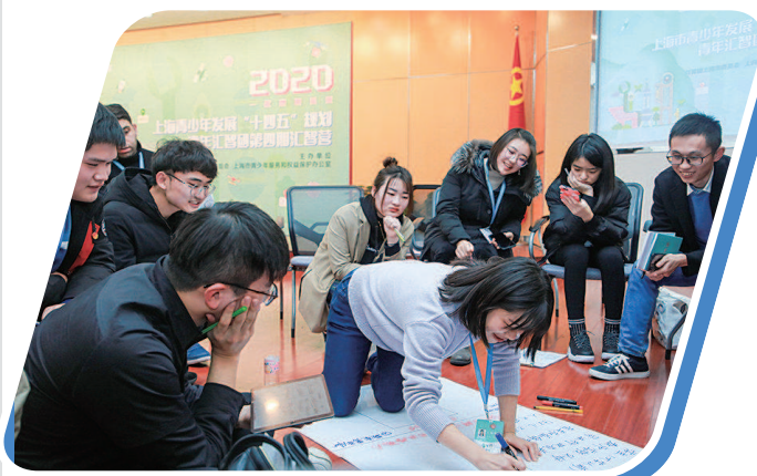
青年学生碰撞思想火花