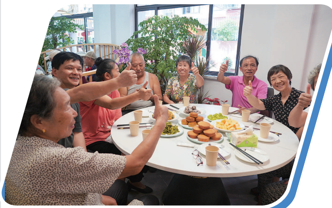
普陀区打造“幸福食堂”