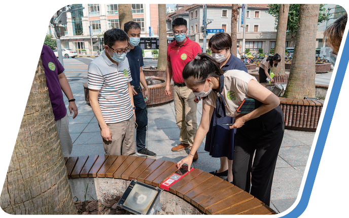
“市民看市容、市民谈市容、市民管市容”主题活动

这些优秀案例,有积极畅通征集渠道的“广开言路”,有探索征集机制创新的“开门问计”,有大力推动建议转化的“惠及民生”,也有讲好征集故事的“民心能量”。下面,就让我们一起来看看这些“阿拉金子”落地生根、“倾听好声音”助力发展的故事。