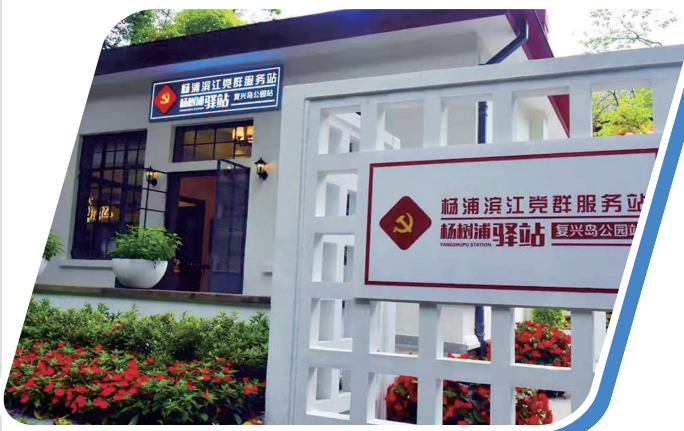
杨浦区依托党群服务站打造杨浦滨江建议征集示范区