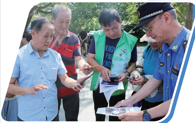
城管进社区和居民零距离接触

这些优秀案例,有积极畅通征集渠道的“广开言路”,有探索征集机制创新的“开门问计”,有大力推动建议转化的“惠及民生”,也有讲好征集故事的“民心能量”。下面,就让我们一起来看看这些“阿拉金子”落地生根、“倾听好声音”助力发展的故事。