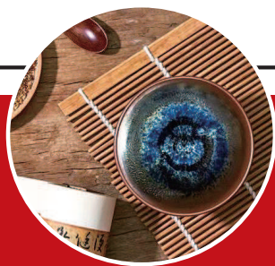
▲ 复刻宋代建盏工艺的“冬奥官帽茶盏”