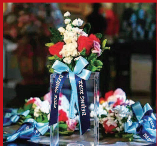
▲ 颁奖台上永不凋谢的“奥运之花”