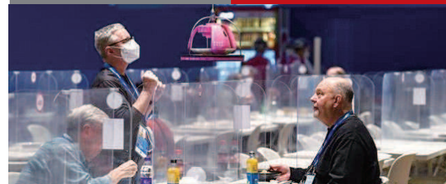
▲ 北京冬奥会媒体餐厅的无接触配送