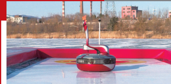
▲ 传递冬奥火炬的机器人