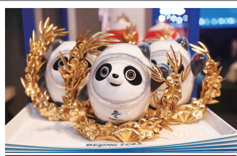
▲ 为获奖运动员定制的纪念版冰墩墩