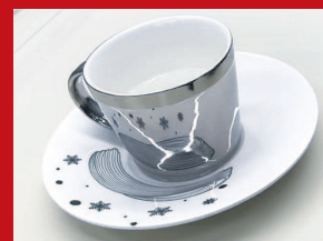
▲ “冰丝带”衍生品“倒影咖啡杯”