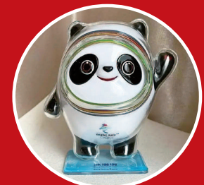
▲ 可爱的吉祥物冰墩墩