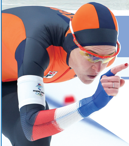
■ 维斯特收获了个人第6枚冬奥金牌

奥金牌、刷新了奥运纪录,也让荷兰人自2006年都灵冬奥会起,参赛必然夺金的定律得以延续。赛后第一时间,这名向来坚强的35岁老将,留下了幸福的眼泪,年岁的增长、伤病的困扰、后辈的冲击……尽管有无数种可能失败的理由,但笑到最后的,还是那个熟悉的“王者伊琳”。