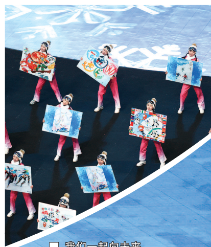
■ 我们一起向未来