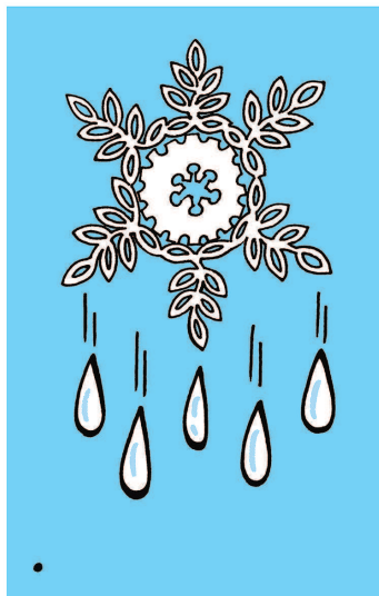
冬奥出彩 挥汗成金！

冬奥会开幕式的主角是人，年轻人、中国人和地球人。清新的小草在风中摇曳，蒲公英悠悠飞向蓝天，在弥漫着中国式浪漫的老二十四节气的开端之际，在万物开始萌动的立春之夜，他们超越地域、种族、宗教、制度的隔阂，在奥运的舞台上向世界大声宣昭，为了人类战胜还在肆虐的新冠肺炎和一切灾难，我们必须共同携手，才能走向未来美好。是的，我们必须“一起”！