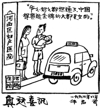
■ 华君武漫画《奥运喜讯》