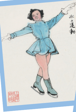
■ 陆俨少作品《冰上运动》