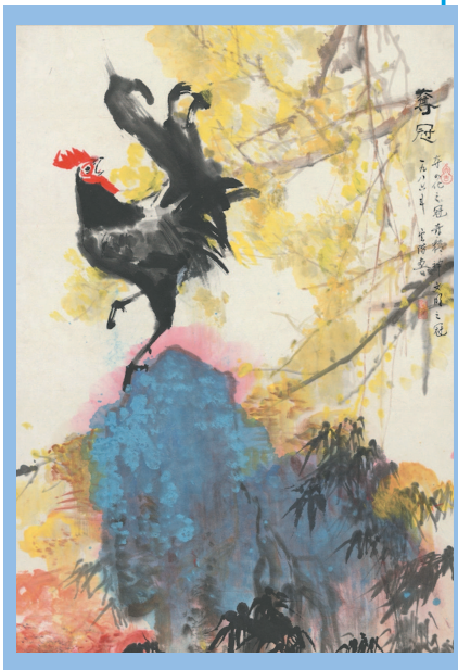
■ 俞云阶的作品《夺冠》