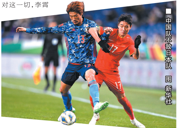
■ 中国队不敌日本队