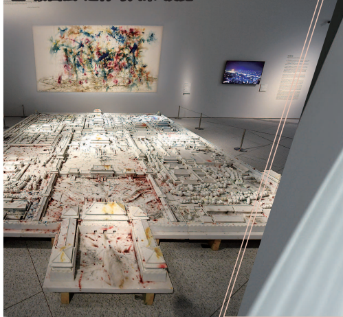
蔡国强“远行与归来”展览

2021年,上海市美术馆名录上新增了浦东美术馆、艺术百代美术馆等12家美术馆,一共收录96家美术馆。上海成为国内拥有美术馆最多的城市。西岸美术馆、浦东美术馆等还被业界誉为“出道即巅峰”。据统计,2021年全市美术馆共举办950项展览,同比增长58.3%;2021年全年美术馆观众参观人次621万,同比增长52.9%,中华艺术宫、西岸美术馆、浦东美术馆、上海当代艺术博物馆、上海黄浦区东一美术馆成为当年观众人次TOP5。正在龙美术馆进行的“盐田千春:颤动的灵魂”等均为国外艺术家在国内首次举办美术馆个展,抢滩上海的背后,是上海在全球秀场中越发凸显的重要性。2022年起,上海黄浦区东一美术馆与意大利乌菲齐美术馆联合,将在五年内呈现十场来自乌菲齐美术馆馆藏的重大艺术展览。