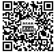
扫一扫,关注“夜光杯”

那时,我正打算把办公室搬离“上海商城”,今后和陈逸飞见面的机会肯定少了,就请大师在我的笔记本上签名留作纪念。陈逸飞英年离别,至今已16年了,他的优雅的签名我一直珍藏着,作为对画家的纪念。