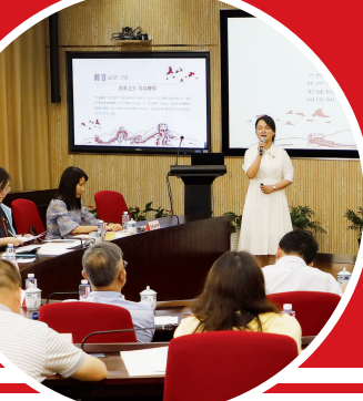
▲ “百年党史听我讲”微课比赛决赛现场

一年来,学院组织开展了多种形式的互动交流型学习。如“领导班子进课堂讲思政”活动,学院领导将党史学习相关内容融入课程,走进课堂与青年学子互动,打造了一系列“年轻人爱听的思政课”,今年以来累计授课43.6课时,人均授课约7学时。以青年读书分享、走进先进班级的方式组织开展两期“书记有约”,党委书记、党支部书记、团委书记共同参加。将专家“请进来”,邀请上海市委讲师团党史学习教育宣讲团成员等作主题演讲,加深广大党员对党史的认识。组织师生“走出去”,开展“行走的党课”实践教育活动、“红色基地大寻访”活动。