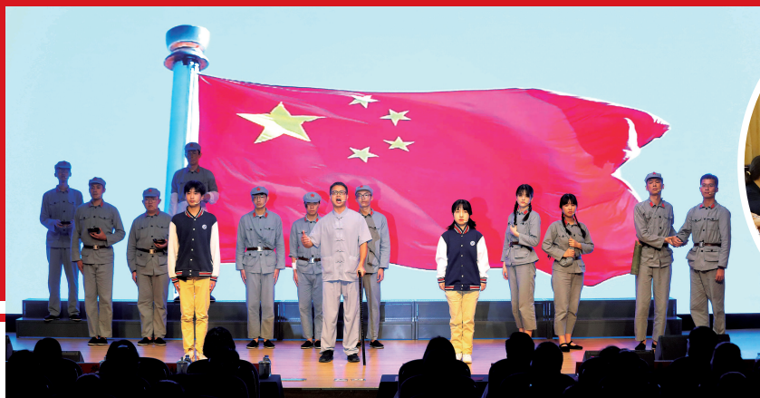
▲ 开展“一眼百年”情景党课活动

从“1921 中国共产党成立”到“1949 开国大典”,从“1990 开发开放浦东”到“2010 上海世博会”……在上海交通职业技术学院的凯旋校区、漕宝校区和浦东校区各有一条特别的台阶吸引着师生的目光。三条台阶的主题分别为“不忘初心、牢记使命”、“奋斗百年路”以及“寻百年征程”。这是学院2021年打造的“红色台阶”,也是学院在党史学习教育活动中求新求实学党史、聚心聚力助育人的众多举措之一。