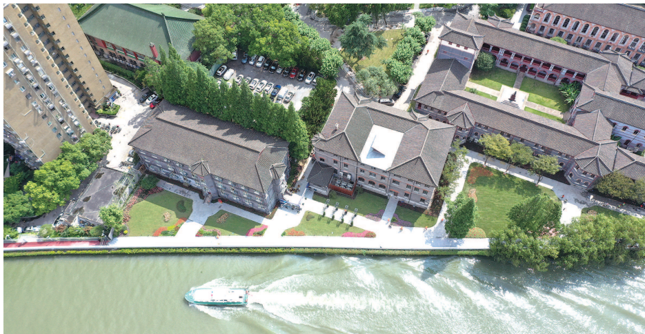
▲苏州河滨水景观提升

崭新展馆,众多案例,见证上海建设“人民城市”的奋斗历程,见证上海城市更新的创新实践,其中六个经典案例堪称——人民城市,上海样本!