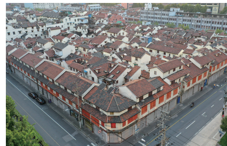
▲宝兴里地块鸟瞰图

宝兴里旧改,打好“三张牌”:打好“亲情牌”回应关切,架起旧里群众“连心桥”;打好“创新牌”提高效率,跑出旧改征收“加速度”;打好“干部牌”锤炼作风,搭好旧改攻坚“练兵场”,与居民群众面对面沟通交流,切实用好“宝兴十法”。