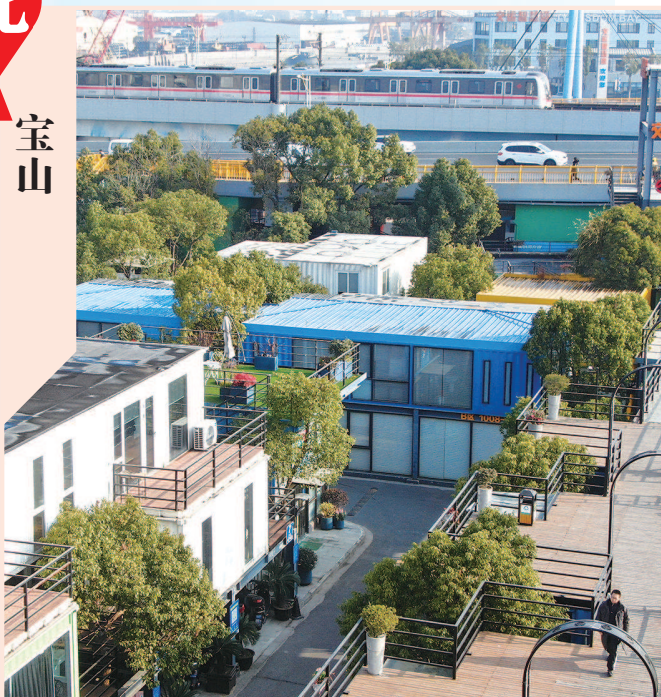
■ 2022首个工作日,宝山智慧湾迎来忙碌的一天