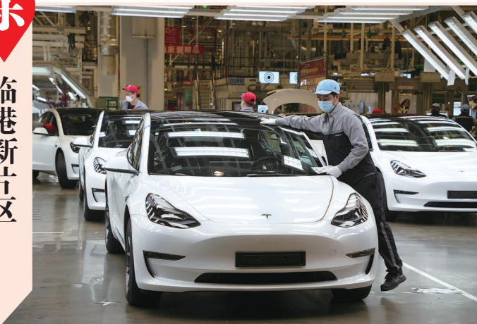
■ 特斯拉上海工厂总装线,工作人员在检查车身