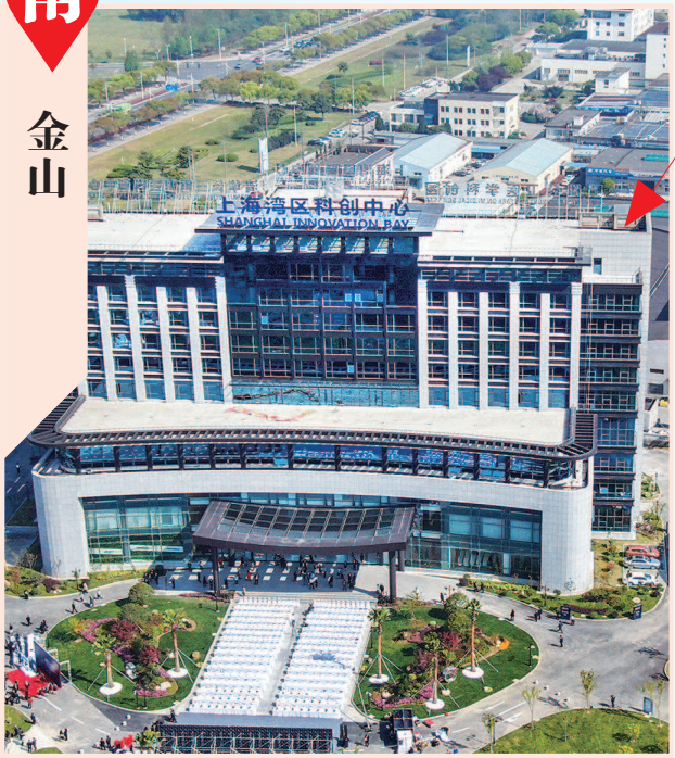
■ 上海湾区科创中心打造“长三角智脑”