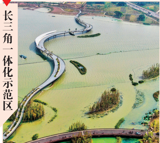
■ 元荡慢行桥横跨沪苏两地

东边,发展势头正猛。西边,也不甘示弱。新年伊始,地处苏沪交界地带的淀山湖畔,总用地约2400亩的华为青浦研发中心正在如火如荼地建设。不远处,造型轻盈的元荡桥飞卧元荡湖上,不仅打通了沪苏两地的“断头路”,还串联起两岸绿意,引得游客争相“打卡”。作为区域协调发展的“样板间”,一幅宜业、宜居、宜乐、宜游的画卷正在长三角生态绿色一体化发展示范区徐徐铺开。