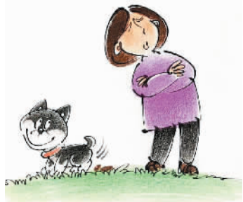
马关根文 孙绍波画

地址:威海路755号新民晚报政法部 Email: dsxq@xmwb.com.cn