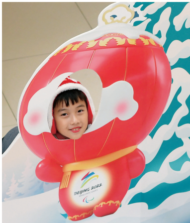
■ 申城小学生和冬残奥会吉祥物“雪容融”合影