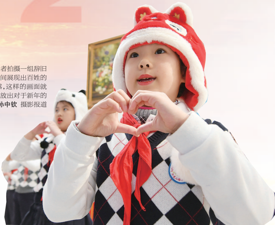
■ 昨天打虎山路第一小学的孩子用舞蹈祈盼新年

2022年到来，本报记者拍摄一组旧迎新笑脸，用定格的一瞬间展现出百姓的获得感、幸福感和安全感，这样的画面就发生在申城大街小巷，绽放出对于新年的期盼。