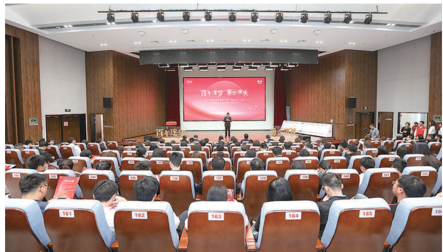
▲“百年逐梦 勇立漕头”干部增能计划启动仪式

面向即将到来的2022年，漕湖街道将紧紧围绕相城区委区政府和苏相合作区党工委、管委会的工作任务和部署要求，坚持党建引领，继续保持凝心聚力、奋勇争先的状态，以善作善成的劲头，以更加坚定的信心和决心，推动街道各项工作再上新台阶。