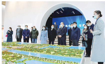
▲双方代表参观考察水乡客厅

服务平台，进一步察民情、知民意、解民忧。通过“叠彩观塘”党建品牌和“‘观’心为民”协商议事品牌落实，推进居民自治，实现良性互动，争创小区治理“红色物业”省级示范点。持续深化与上海曲阳路街道结对共建，推进党建引领社会治理，双方开展联组学习，交流社会治理经验，助力提升社会治理实效。