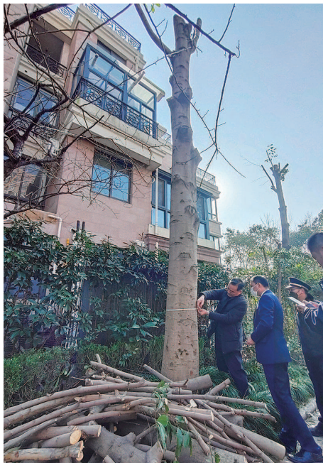
■ 绿化、城管、房管等多部门来到现场查看

本报讯(记者 夏韵)12月22日,本报9版刊发了《修剪变“砍头”只因香樟太茂盛?》的报道。记者了解到,针对小区大树被“砍头”、遭砍伐一事,属地浦东新区洋泾街道综合行政执法队(城市管理行政执法中队)已立案调查。