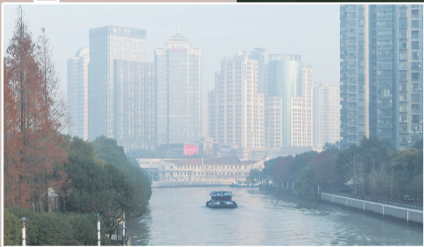
■ 苏州河上飘着一层薄雾