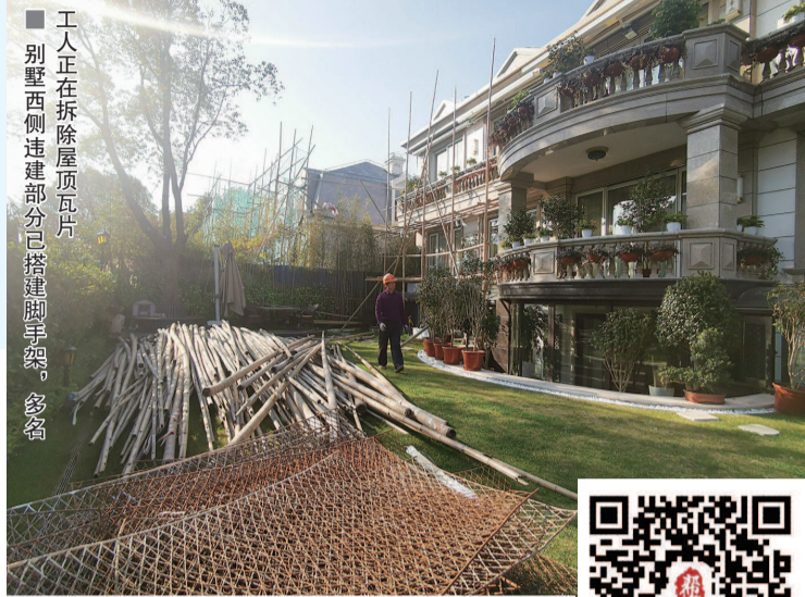
工人正在拆除屋顶瓦片 别墅西侧违建部分已搭建脚手架,多名

依据《上海市拆除违法建筑若干规定》第九条的规定,本机关现予以公告,责令当事人自收到《责令限期拆除违法建筑决定书》之日起7日内自行拆除上述违法建筑,逾期不拆除的,本机关将依法报请上海市浦东新区人民政府强制拆除。