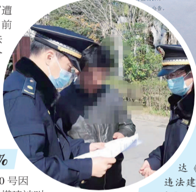
▲城管执法人员向别墅业主依法送达《责令限期拆除违法建筑决定书》,并贴出《公告》

有钱就能任性?当“最豪违建”遭遇“最严执法”,后果真的很严重!前天中午,浦东新区金桥镇城管执法中队向该别墅业主依法送达《责令限期拆除违法建筑决定书》,贴出《公告》:责令当事人在收到拆除决定书之日起7日内自行拆除违法建筑;逾期不拆除的,金桥镇政府将依法报请区政府强制拆除。