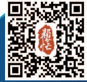
本版编辑/胥柳曼 视觉设计/竹建英

据了解,这里是之前备受争议的“老年相亲角”。对此不少市民认为,商场餐厅区域是“就餐区”,不是“聊天区”“社交区”。他们呼吁,市民应遵守公序良俗,文明逛商场,不应占座聊天,请把座位留给“就餐者”。另一方面,商场也要加强引导、劝阻,让购物和就餐环境变得有序起来。