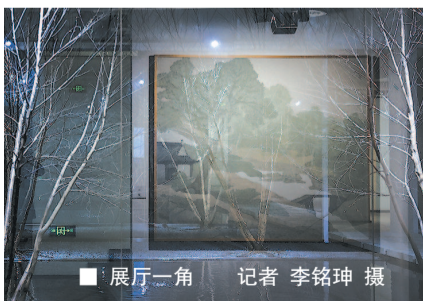
展厅一角