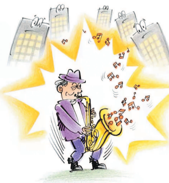
陈佳琳 文 孙绍波 画