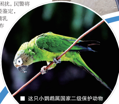
这只小鹦鹉属国家二级保护动物