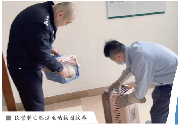
民警将白狐送至动物园收养