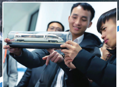
▼ 老挝留学生在上海学习

在世贸组织前总干事帕斯卡尔·拉米看来,人类当前面临疫苗鸿沟、数字鸿沟、碳减排鸿沟以及贫富鸿沟这四条鸿沟的挑战。这些鸿沟在疫情前就已存在,“新冠疫情加剧了这些鸿沟的严重性”。面对比以往更难弥合的鸿沟,以及这个全球化和互联互通的世界,分歧就好像毒药一般有害。“如果不能团结起来应对这些挑战,所有人都会深受其害。”