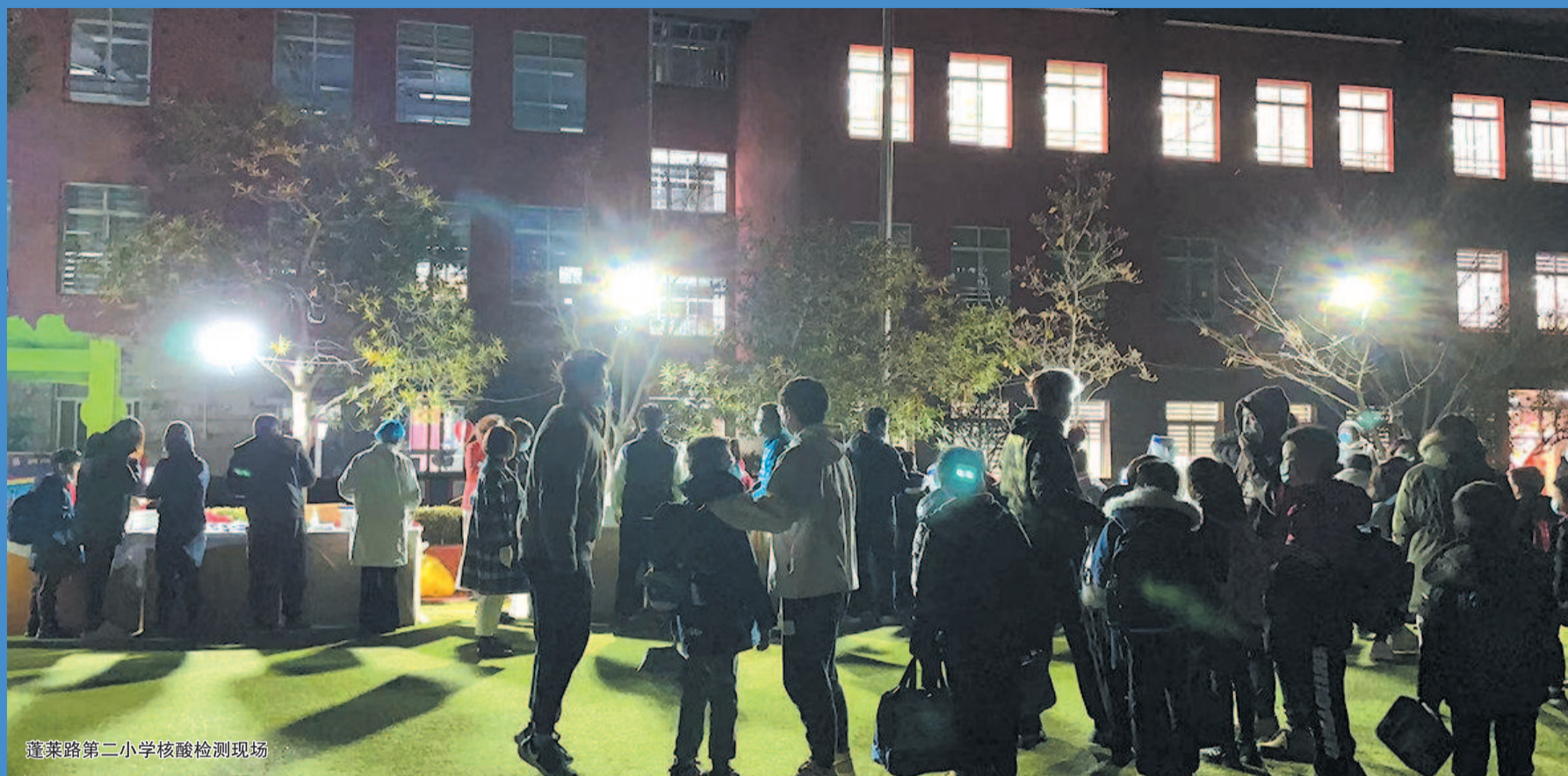
蓬莱路第二小学核酸检测现场