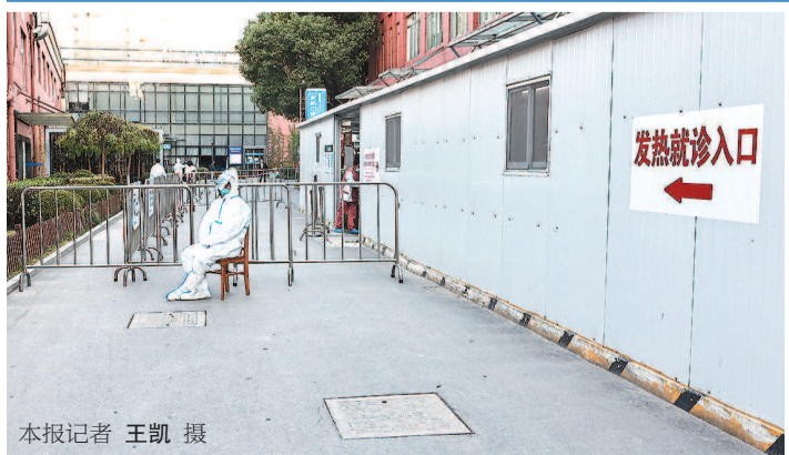
本报记者 王凯 摄

本报讯(记者 左妍)有网友询问,仁济医院东院是否闭环管理?对此,上海发布回复,经过流调显示:确诊病人首诊至仁济医院(浦东院区)的发热门诊就诊,未到过医院其他区域,而医院发热门诊是严格按传染病诊治要求做好隔离措施的,实行“六不出门”管理。该病例检测异常后未离开发热门诊,由闭环转运至定点医院。因此仁济医院无需封闭。