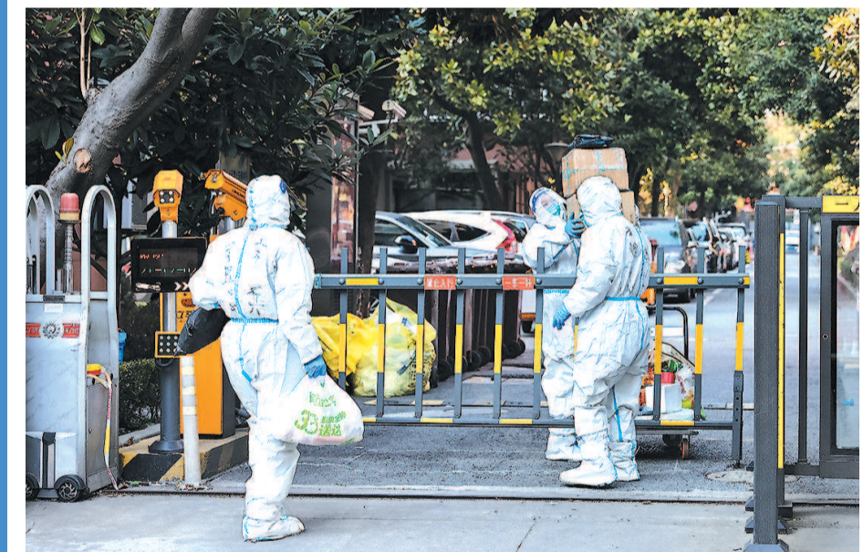
牡丹路186弄小区封闭管理