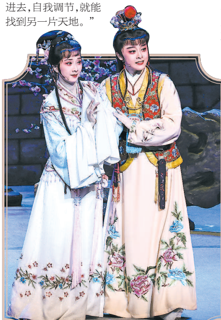
越剧《红楼梦》剧照