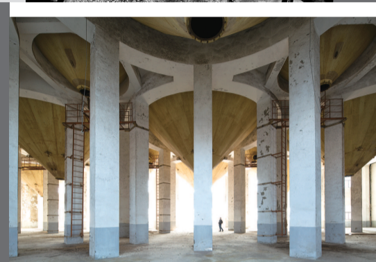
▲ 黄浦江畔的工业遗存纪事·民生粮仓