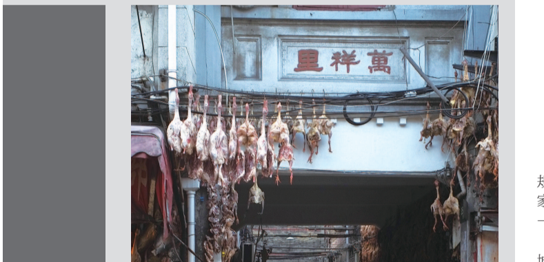
▲ 弄堂年味 刘刚 摄