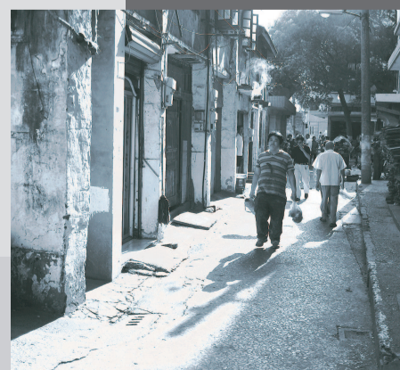
▲ 青村纪事·归