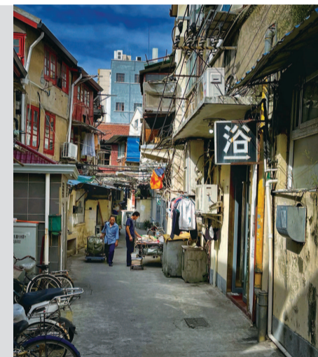
▲ 街坊时廊