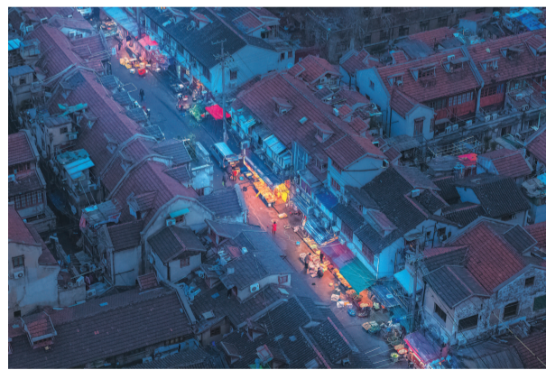
▲ 上海的日常空间·唐家湾路