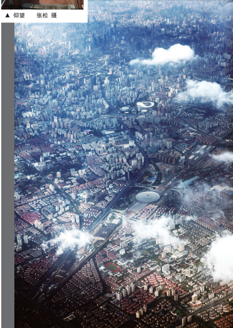
▲ 俯瞰上海·城市里的大站

正在同济大学博物馆进行的“十二街坊”影展是一次以上海城市空间为主题的视觉文化活动，通过这些跨越时空的影像资料，观众似乎能探寻到上海这座城市更多的文化特质和市井气息。