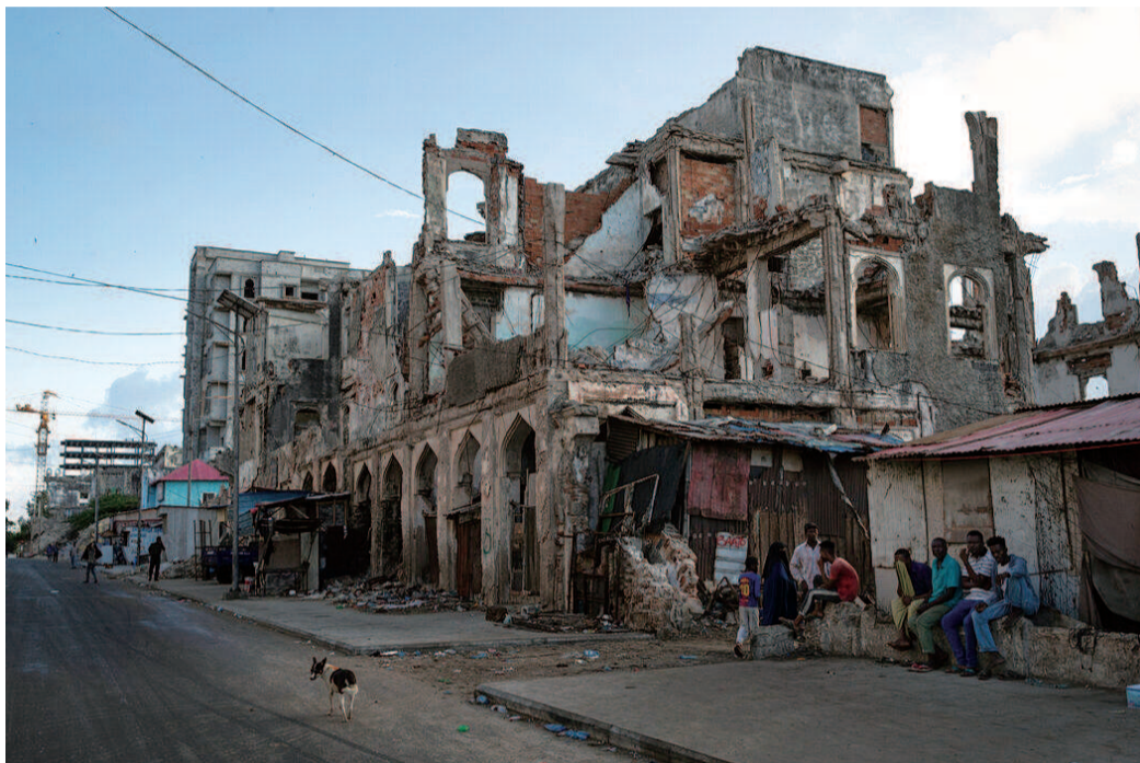
▲ 摩加迪沙街道上随处可见战争留下的伤痕 ▶ 阿灵顿公墓里古德曼的临时墓碑 ▼ 索马里安全部队在遭遇炸弹袭击的房屋废墟前