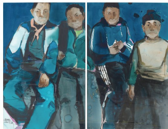
■ 王涛 我的小学 (水彩画) 白玉兰美术奖佳作奖

以学术研讨的形式,及时梳理总结大展的成果,分析研究大展中出现的现象,提出引领未来美术创作的建设性意见和建议。大展学术研讨会在颁奖仪式结束后召开:如何进一步提高上海美术创作水平,使之与国际文化大都市地位相匹配;如何形成合力,更好打造出人才、出作品的平台机制,这些都是美术界的焦点话题。