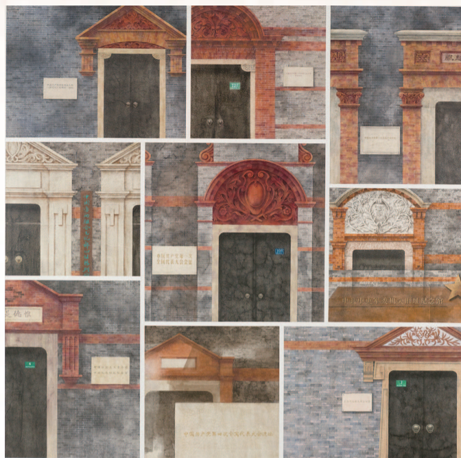
■ 洪健 上海·红色起源地 (中国画) 白玉兰美术奖佳作奖