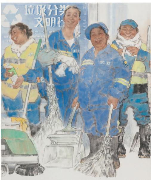
■ 齐然 都市笑容 (中国画) 白玉兰美术奖佳作奖

笔墨与造型扎实又轻松,人物塑造富有典型性,疏密得当,阳光般的表情、由内而外的笑容让人心生明媚。