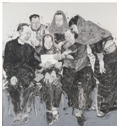
■ 李忠印 当你老了 (中国画) 白玉兰美术奖 佳作奖

用写意的方法塑造人物,表现敬老爱老的主题。造型、构思与构图都比较完美,笔墨很见功力。