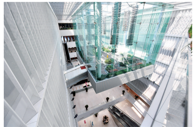
浦东图书馆六层空中花园

浦图地下一层有一间小屋,放着几台电脑、一台巨大的显示器,还有几面墙的盲文书籍,这是“视觉障碍者阅览室”。视觉障碍者徐斌就是例子。他在这里聆听了一节电脑培训课,从此推开阅读的大门,如今更是成为一名图书馆志愿者。浦图常年为视障读者开展电脑培训、系列读书活动,为视障读者提供盲人书刊、有声读物、智能听书机,开展“无障碍电影”讲解。浦图还会派工作人员去地铁站接视障读者到图书馆,免费为他们