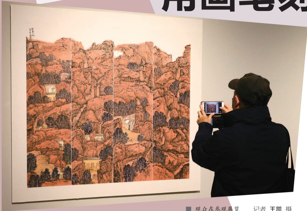
观众在参观展览