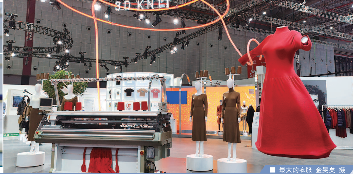
■ 最大的衣服