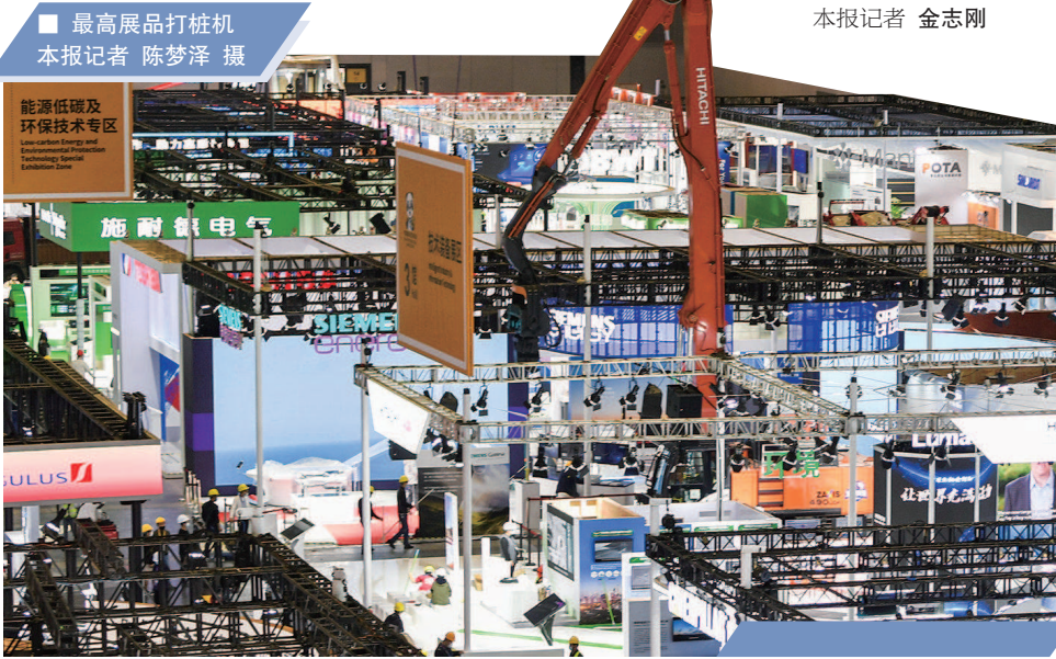
■ 最高展品打桩机

金或玫瑰金的戒托上，成为一款独具特色的戒指。 这款珠宝台灯是今年进博会第一次展出的，售价为130万元。“我们希望通过展品，把‘珠宝融入生活’的概念带给消费者。此次展品中，还有一些是珠宝与刺绣结合的，也融入了这样的理念。”黄媛媛表示。 本报记者 金昱矣