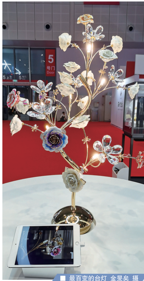
■ 最百变的台灯

菜，焖炖、混炒、烧烤、西餐、西点、中式面点等都不在话下。在“机器大厨”的辅助下，烹饪效率大大提升，三菜一汤约莫一个半小时就几乎能全部搞定。粗略估算一下，15分钟内，“机器大厨”便可烹饪约1000只鸡翅，或者24公斤蛋炒饭！通过高温设置，鸡翅、薯条等孩子们爱吃但油脂丰富食物，可以实现少油烹饪，让孩子们吃得更健康。记者尝了一口大厨“精准烹饪”的成果——虾仁、红烧肉软硬程度刚刚好，生菜仍旧“碧绿生青”，味道不错！ 展区的大屏幕上，展示着光明营养午餐实现从田间到餐桌“一条龙”的未来。根据设想，今后，每一种食材产自何处，每一份午餐营养成分多少，每一辆送餐车去往何处，都能够准确跟踪。 首席记者 陆梓华