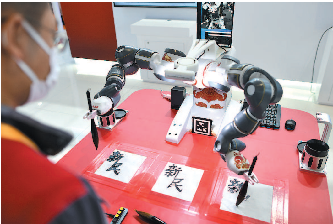
■ 技术装备展区,ABB带来机器人YuMi“左右开弓”写毛笔字。通过引导式编程,YuMi写下“新民”二字