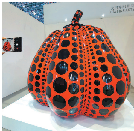
▲ 服贸展区展示的草间弥生的作品“南瓜”