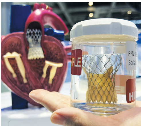
▲ 医疗器械展区展商美敦力带来全球最新一代经导管植入式主动瓣膜