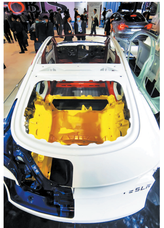
▲ 汽车馆中展示的特斯拉Model Y ▲ 消费品展区欧莱雅展台“口红打印机”吸引观众驻足