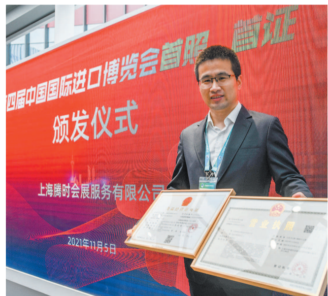
■ 今天上午，进博会颁发首张营业执照

今天新成立的腾时，是德国功能性面料展(Performance Days)组展商在青浦西虹桥商务区新成立的会展服务公司。德国功能性面料展，是德国功能性纺织品领域的知名展会品牌，主要面向高品质功能性纺织品及相关服装品牌的开发采购及对接，享有国际声誉。新成立的展览服务公司，主要服务于展商即将举办的上海国际功能性纺织品展览会(Functional Textiles Shanghai by Performance Days)，该展会将为全球功能性纺织品供应商和国内品牌、采购方搭建沟通平台，并结合欧洲和国内最新行业信息提供趋势引导。此次拿到营业执照和经营许可证，意味着德国功能性面料展将进一步植