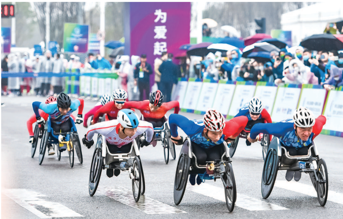
上海运动员包揽轮椅竞速马拉松男女组冠军