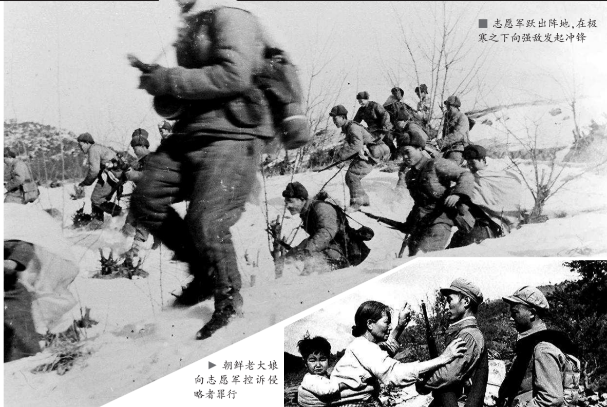
■ 志愿军跃出阵地，在极寒之下向强敌发起冲锋