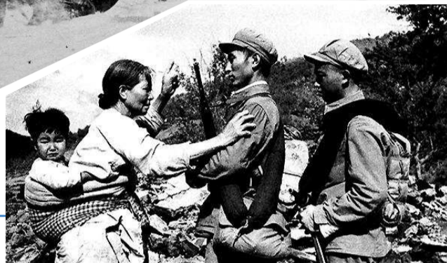
▶ 朝鲜老大娘向志愿军控诉侵略者罪行